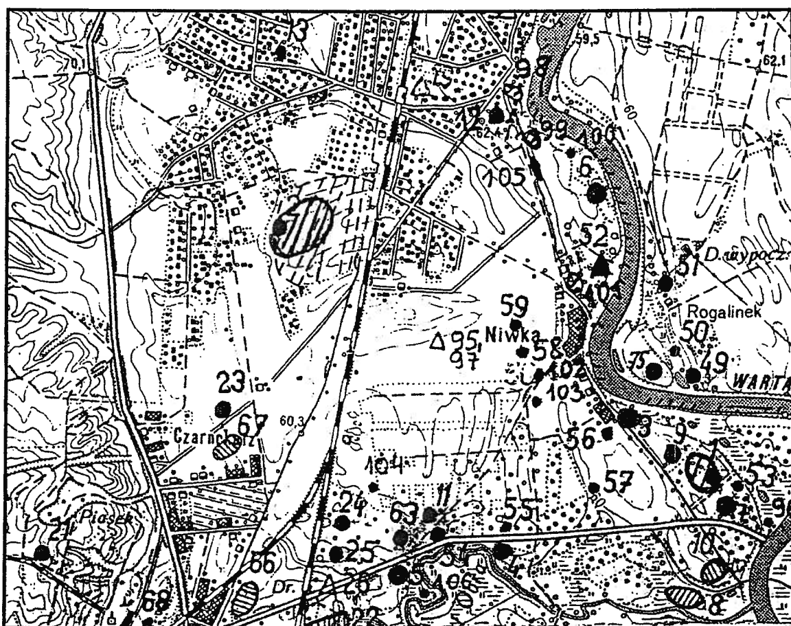
Ryc. 2. Rozmieszczenie stanowisk archeologicznych wokół Mosiny Czarnokurza. (Wg. AZP).

Najstarsze ślady pobytu ludzi z okolic Mosiny Czarnokurza zarejestrowano na wschód od nadzorowanej inwestycji, na terenie podmokłym w pobliżu obecnego koryta Warty, obecnie jest to dzielnica Puszczykowa - Niwka 1 . Natomiast w rejonie objętym nadzorem najstarsze stanowisko (nr 67) znajdowało się w południowej części inwestycji. Odkryto na nim ślady związane są z obozowiskami paleolitycznych łowców reniferów (10 000-8000 l. p.n.e.), którzy pozostawili po sobie grociki i narzędzia krzemienne, ślady z tego samego okresu zanotowano na stan. 2. Kolejny ślad, tym razem z okresu mezolitu (8 000 – 5 000 l. p.n.e.) odnotowano na stanowiskach 2 i 23.